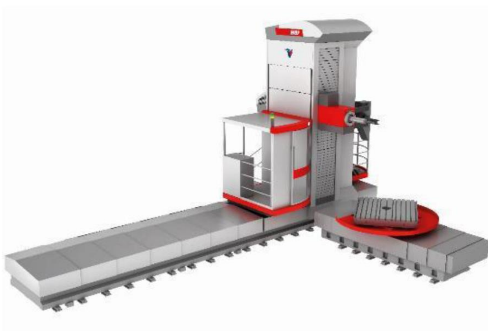
Horizontalni CNC obdelovalni center WRF 150 CNC (del. območje osi X/Y/Z/W osi 15,3/ 4,1,2/ 1 m)